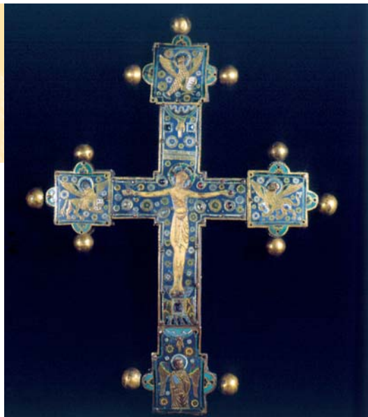
Trésor de la cathédrale Saint-Jean de Lyon Crucifix du XIII e siècle