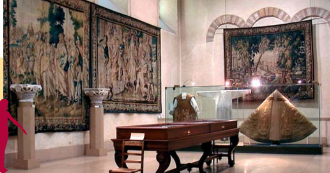
Trésor de la cathédrale Saint-Jean de Lyon