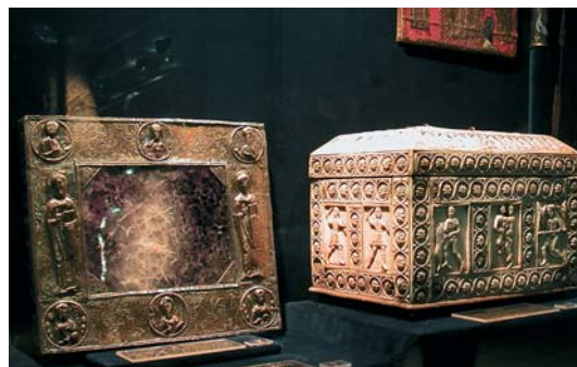
Cloître et trésor de la cathédrale Saint-Jean